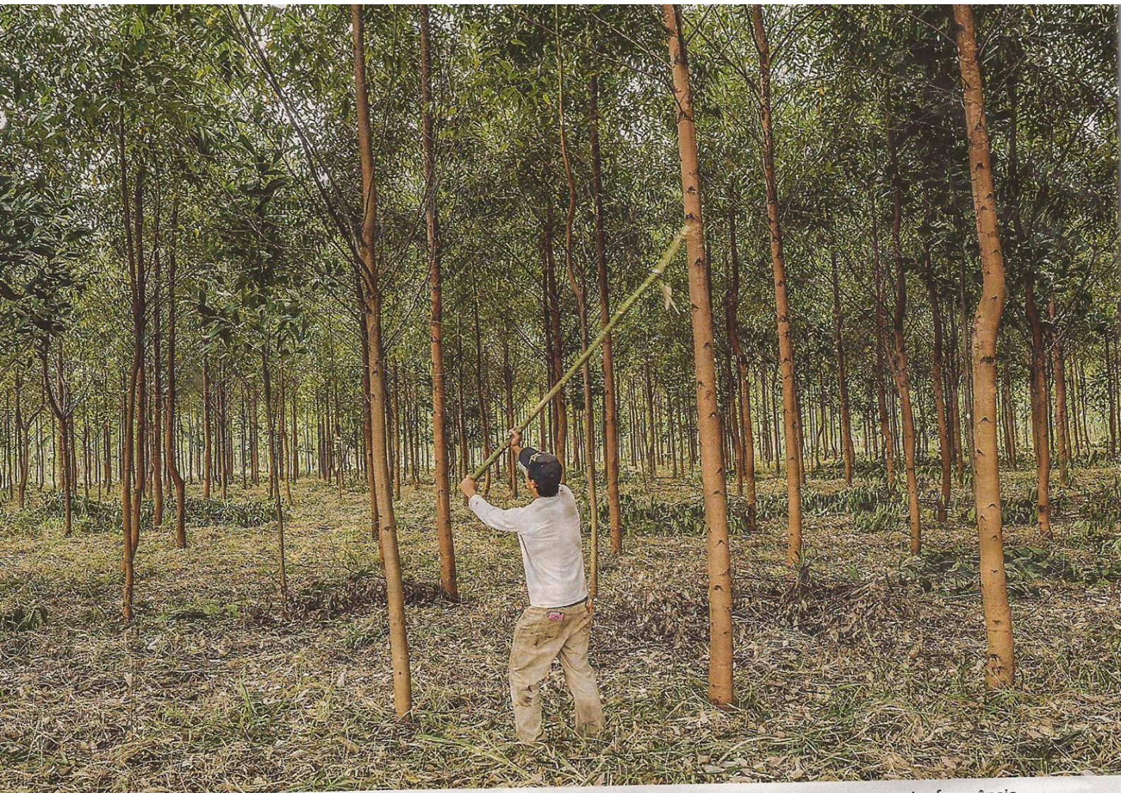
CAMPO DE TRABALHO Ao utilizar a nova forma de plantio, o agricultor precisa podar árvores com maior frequência

“ E stou dizendo que tanto o orgânico quanto o convencional extraem mais do que deixam na natureza, e aí o custo fica alto para o ecossistema e para o produtor. Quem sabe a agricultura sintrópica seja um caminho melhor.” O discurso pode parecer o de um ambientalista no pleno exercício de sua militância contra as agressões ao planeta, mas foi dito no universo da ficção, na voz de um personagem de novela. Em Velho Chico , o atual folhetim das 9 da noite da Rede Globo, o jovem Miguel, filho do casal protagonista, tenta convencer seu avô conservador, o Coronel Saruê, e pequenos agricultores de Grotas (cidade imaginária à beira do Rio São Francisco) a adotar a sintropia. Na trama, que não decolou no ibope do